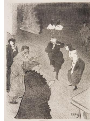
Henri Gabriel Ibels: Une répétition aux Folies bergère , 1893