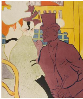
Henri de Toulouse Lautrec: L'Anglais au Moulin Rouge , 1892