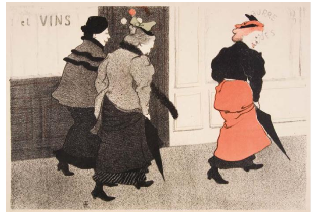
Paul Hermann: Modistes , 1894