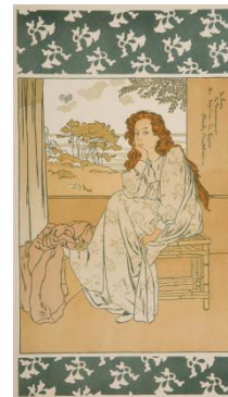
Henri Gabriel Ibels: Jeune femme assise, 1896