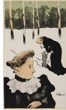
Ker Xavier Roussel: Dans la neige (l'éducation du chien), 1893