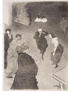
Henri Gabriel Ibels: Une répétition aux Folies bergère, 1893