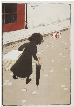
Pierre Bonnard: La petite blanchisseuse , 1896