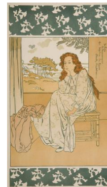
Henri Gabriel Ibels: Jeune femme assise , 1896