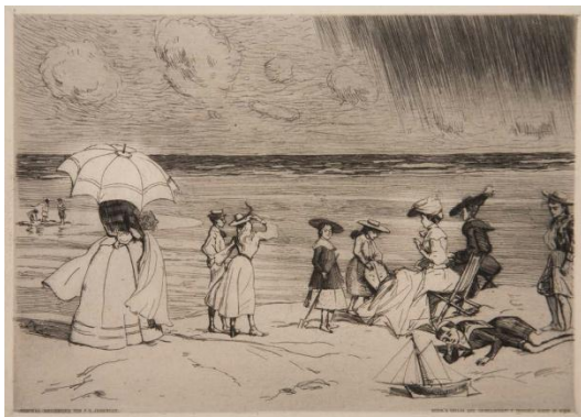
Pierre Georges Jeannot: Sur la plage , 1906