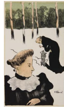
Ker Xavier Roussel: Dans la neige (l'éducation du chien) , 1893